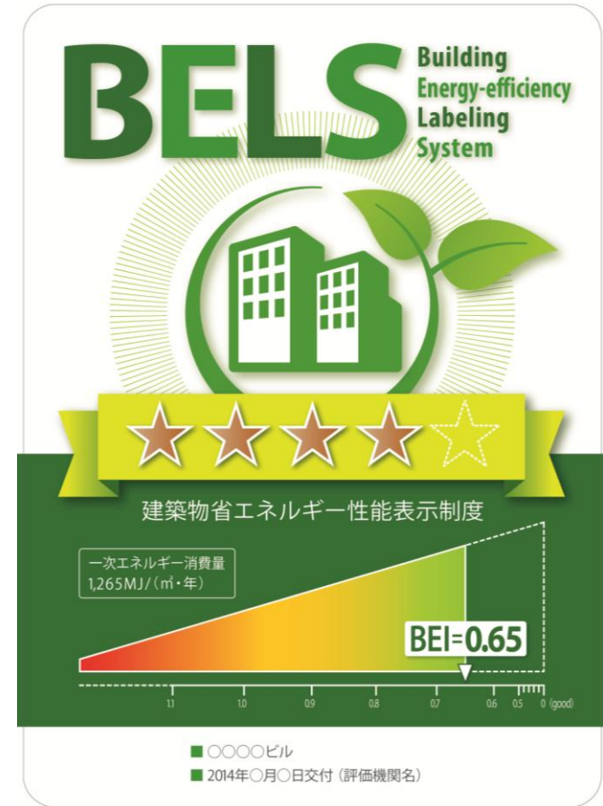
表示プレートのイメージ(案)