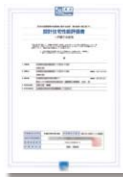
設計住宅性能評価書