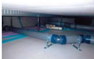
屋根裏や床下の配管も、メンテナンスを想定して設計されています。