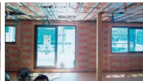
しっかりとした設計と施工。そして記録を残すことは将来のメンテナンスの大きな助けになります。

ポイント 住宅の寿命を延ばすことで解体による環境負荷を減らす「長期優良住宅」は、年月が経っても資産価値のある住まいです。「長期優良住宅」は、9項目（劣化対策、耐震性、維持管理・更新の容易性、可変性、バリアフリー性、省エネルギー性、居住環境、住戸面積、維持保全計画）の基準を満たさなければなりません。