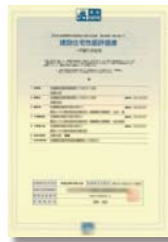
建設住宅性能評価書