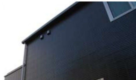
外見と性能で選んだ陶板の外壁。

秋と冬を暮らしてみてもわかったのは、家の暖かさ。窓ガラスは紫外線をカットしてくれるし、結露も少ない。お掃除も管理も楽ですね。午前10時から電気代があがるので、それまでに部屋を暖めるようにしています。一度暖めてしまえば温度がキープされるので、まったく寒くないです。外壁は陶板にしました。アクセントで使