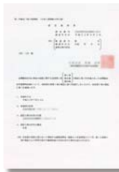
長期優良住宅認定通知書